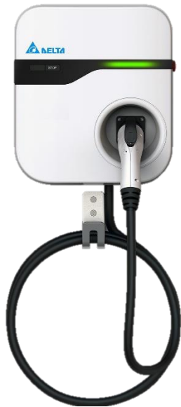
表1 6kW 壁掛式充電器